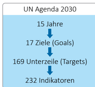
Grafik: Aufbau Agenda 2030

Die Agenda 2030 für eine nachhaltige Entwicklung wurde am 25. September 2015 von der Vollversammlung bzw. den Staatsoberhäuptern der UN-Mitgliedsstaaten in New York verabschiedet (Vereinte Nationen, 2015). Im Zentrum der Agenda 2030 steht eine breite und mehrdimensionale Auffassung vom Wohlbefinden der Menschen, wie auch ein ausbalanciertes Bild der ökonomischen, sozialen und umweltrelevanten Aspekte der Nachhaltigkeit. Die Agenda 2030 enthält 17 Ziele (Goals) mit 169 spezifischen Zielvorgaben (Targets), welche bis 2030 umgesetzt werden sollten.