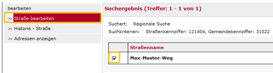
ABBILDUNG 4.12 STRASSE BEARBEITEN AUSWÄHLEN

So gelangen Sie zur Bearbeitungsmaske um die Daten der Straße zu bearbeiten. Sie können nun im Feld Straßenname den alten Namen überschreiben (Abbildung 4.13).