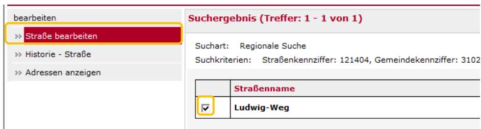
ABBILDUNG 4.15 MENÜAUSWAHL STRASSE BEARBEITEN

So gelangen Sie zur Bearbeitungsmaske um die Daten der Straße zu bearbeiten. Sie können nun im Feld Status den Status der Straße ändern (Abbildung 4.16).