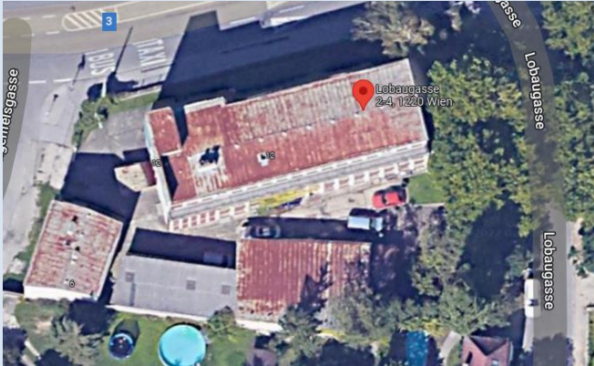
Beispiel 1: Abgerissene Fabrik