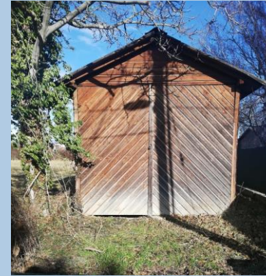
Beispiel 2: Scheune und kein Einfamilienhaus