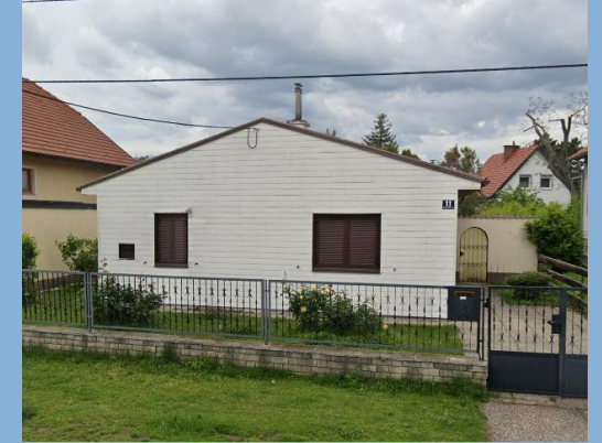
Beispiel 3: Einfamilienhaus ohne Meldung