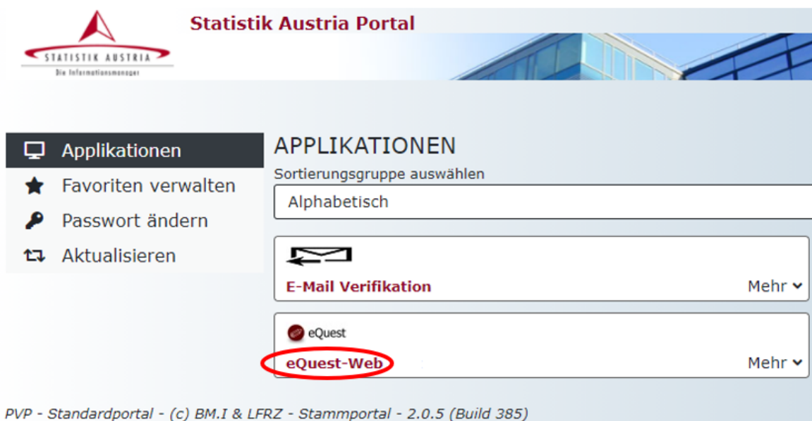
Abbildung 1 Bildschirmsicht nach erfolgreicher Anmeldung im Portal

Nach erfolgreicher Anmeldung wählen Sie bitte unter APPLIKATIONEN eQuest-Web , um zur Fragebogen-Auswahl zu gelangen (siehe Abbildung 1).