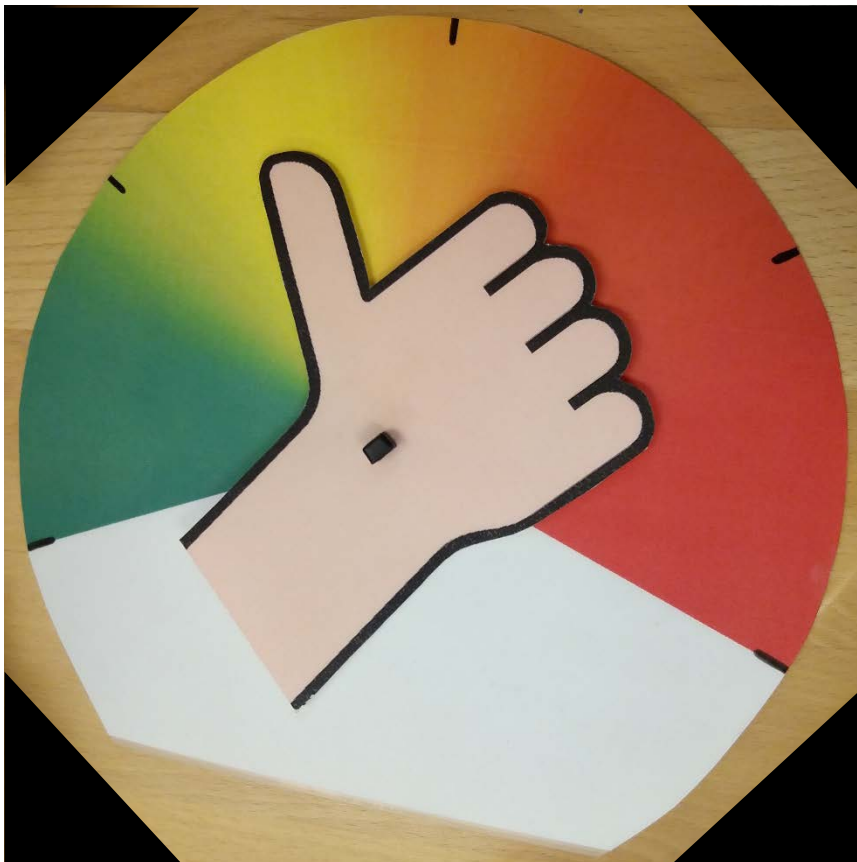
Abbildung 4: Daumenkarte der Caritas.