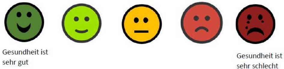
Abbildung 1: Skala Gesundheit. Frage 4: Einschätzung der allgemeinen Gesundheit.